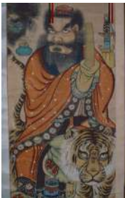
Zhang Daoling, fondateur légendaire du taoïsme religieux

Du 10 octobre au 30 janvier, sauf 17 octobre