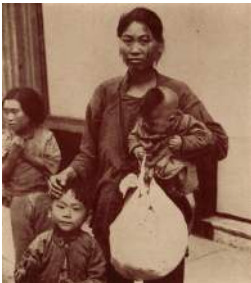
The story of « The Jacquinot Zone », A refugee mother with her children and all her worldly goods

L'exposition sera ouverte le week end du patrimoine. Des conférences et un film seront projetés sur le père Jacquinot pendant les deux jours. Elle continuera sous une forme plus réduite jusqu'au 13 octobre.