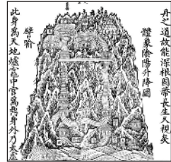
La montagne : image du corps spirituel taoïste

Les séances auront lieu les mardis, de 9h à midi, et seront proposées en hybride, présentiel et distanciel.