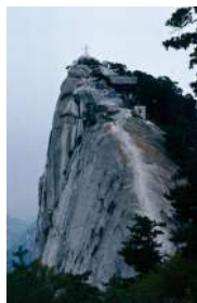
Approche finale du sommet de Huashan