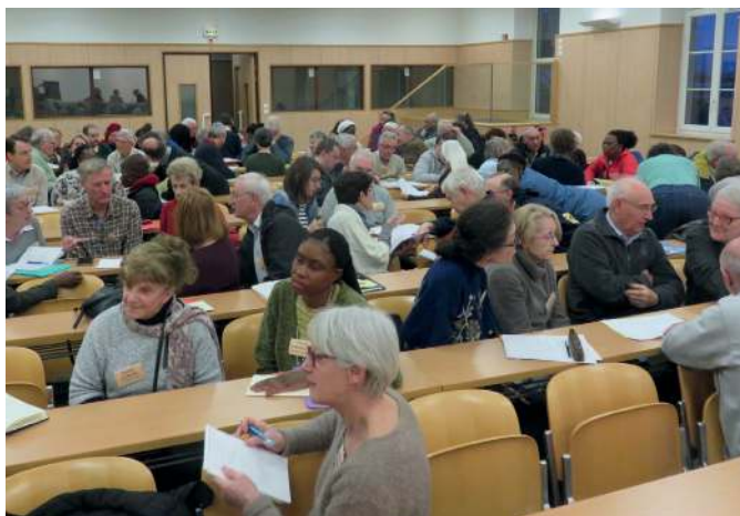
Session de théologie du Réseau Saint Laurent, Nevers, 2018 – Fondation Jean Rodhain

Chaque année, des cours, des séminaires et une soirée-conférence sont organisés sur le thème de la charité et de l'engagement avec des très pauvres, pour en souligner les enjeux théologiques, pratiques et spirituels. Sans qu'ils soient présentés dans ce document, un certain nombre de travaux dirigés et d'ateliers ouverts uniquement aux étudiants des cycles canoniques sont aussi proposés par la chaire.