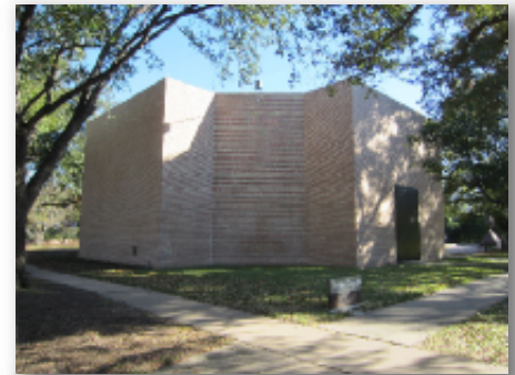
Rothko Chapel