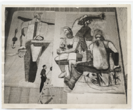
Philip Guston brossant une fresque (American Artists - PubD)

Aurorale? L'œuvre d'art n'est ni un objet à la manière des objets du monde que l'on peut reproduire par maîtrise technique, ni la réalisation unique, authentique et vraie, réservée à une élite, d'une idée d'où elle naîtrait. Elle ne se réduit pas à une fonction sociale, morale ou politique même si elle prend place dans un espace social, celui des hommes, ouvre au sens moral par l'expérience de la beauté, fait époque en un temps politique sans être nullement le produit de ce temps politique. Elle n'est pas plus du côté du temps quand elle est musique qu'elle n'est du côté de l'espace quand elle est peinture: le temps est aussi présent dans la peinture; l'espace est aussi présent dans la musique. Elle est immanente au matériau dans le travail qu'on lui fait subir, y compris par la technique, ce que l'on perçoit si nettement dans l'architecture et aussi en toute création artistique.